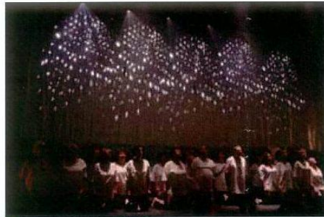
■ Concert de juin 2009 à ForuMeyrin.

Ce choix reflète l'ocumenisme exigé par son directeur où la notion de barrière n'a pas cours. La sélection